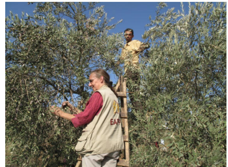
Foto: Freiwillige von EAPPI helfen bei der Olivenernte.

Es wäre aber ein Irrtum, anzunehmen, dass ausschließlich internationale Organisationen in diesem Feld tätig sind. In vielen Ländern gibt es lokale oder nationale Organisationen, die erfolgreich ihre Mitbürger*innen vor Schaden bewahren.