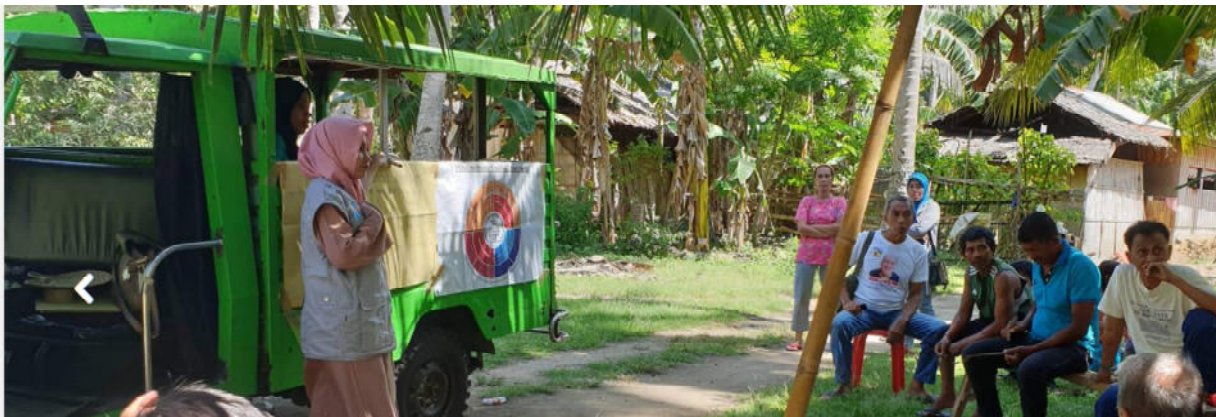
Foto rechts: Operazione Colomba in Kolumbien, https://www.operazionecolomba.it/galleries/colombia/2020/

Es wäre zu wünschen, dass bei einer eventuellen Weiterentwicklung des Konzepts von SnD Zivilem Peacekeeping als gewaltfreiem Ansatz eine größere Rolle eingeräumt würde. Auch wenn es eine größere Akzeptanz des Szenarios von SnD sichern mag, wenn den Vereinten Nationen eine Restmenge von Gewaltkapazitäten eingeräumt wird: Es sind gerade dieselben Vereinten Nationen, die in mehreren Berichten den Ansatz des Zivilen Peacekeepings als wirksam hervorheben. Warum also zumindest nicht auch den Ausbau Zivilen Peacekeepings vorschlagen?